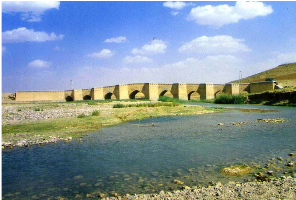
پل فرهادآباد (قروه)

این پل در ۱۵ کیلومتری شمال غربی شهرستان قروه، در روستای فرهادآباد قرار دارد و در مسیر جاده قدیمی بیجار، روی رودخانه بایتمر احداث شده است. پل فرهادآباد دارای ۸ دهانه و ۸۰ متر طول است. چشمه‌های وسط این پل بزرگتر از دیگر چشمه‌ها است. نوع قوس به کار رفته در این پل عموماً جناقی است. تاریخ پل به طور دقیق مشخص نیست و با توجه به شیوه معماری آن به نظر می‌رسد که به احتمال قوی از پل‌های دوران صفویه باشد. این پل در زمان حکومت خسروخان اول مقارن با حکومت زندیه تعمیر و بازسازی شد.