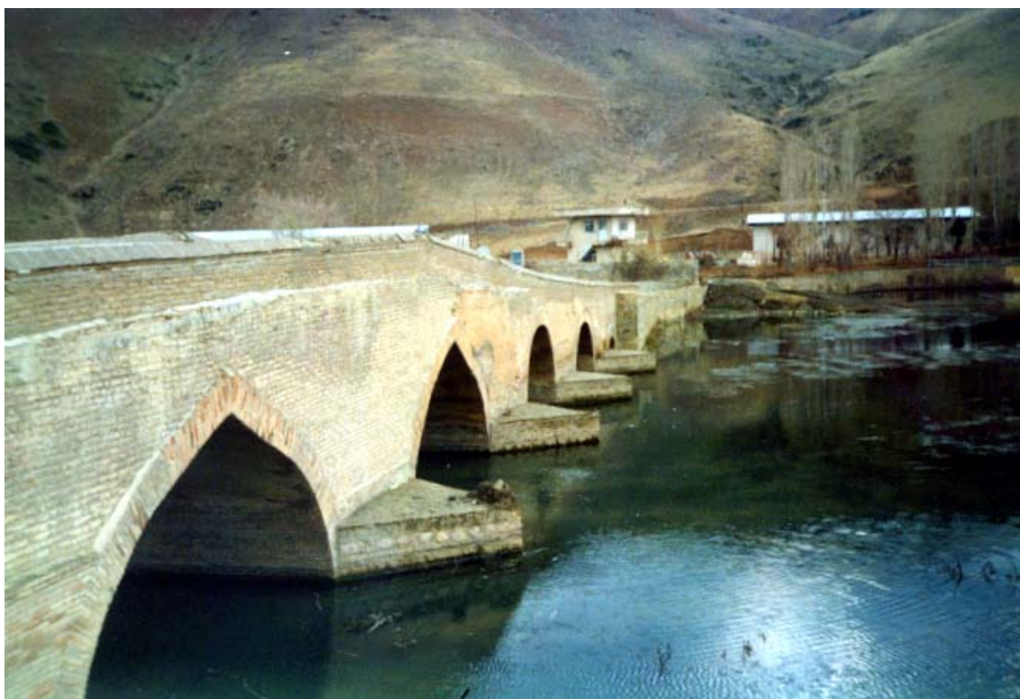
پل شیخ (سنندج)

پل در دو کیلومتری شمال شهر سنندج و در مسیر جاده آسفالته روستای باباریز و خلیجیان روی رودخانه قشلاق احداث شده است. این پل در مسیر ارتباطی سنندج به بیجار و زنجان قرار دارد. تاریخ دقیق ساخت پل و نام بانی آن مشخص نیست، اما با توجه به فرم ساخت و شیوه اجرای معماری طاق‌ها و پایه‌ها، گمان می‌رود که این پل در دوره قاجاریه ساخته و به تدریج در دوره‌های بعد مرمت شده است. پهنای پل شیخ ۵/۳ متر و ارتفاع آن از کف رودخانه ۶/۷ متر است پل دارای شش دهانه است.