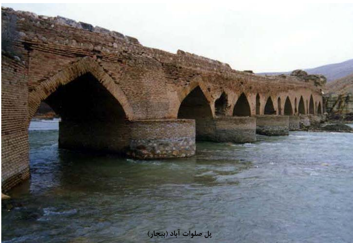
پل صلوات آباد (بیجار)

پل در ۱۵ کیلومتری جاده آسفالته بیجار - تکاب در روستای صلوات آباد روی رودخانه قزل اوزن احداث شده است. پل در مسیر ارتباطی سلطانیه و زنجان با دیگر شهرهای غرب کشور از جمله بهار همدان، کرمانشاه و سنندج قرار دارد. تاریخ دقیق پل مشخص نیست، اما از شواهد پیداست که این پل با عناصر ویژه دوران صفویه به ویژه سنگ‌های حجاری شده و الگوهای معماری این دوران احداث و در دوره‌های بعد مرمت شده است. پل صلوات آباد دارای ۹ چشمه با دهانه‌های متفاوت است. طول پل ۱۳۰ متر و ارتفاع آن به نسبت موقعیت و توپوگرافی محل، بین ۸/۴ تا ۱۲ متر متفاوت است. و در فهرست آثار ملی به شماره ۱۶۰۷ ثبت شده است